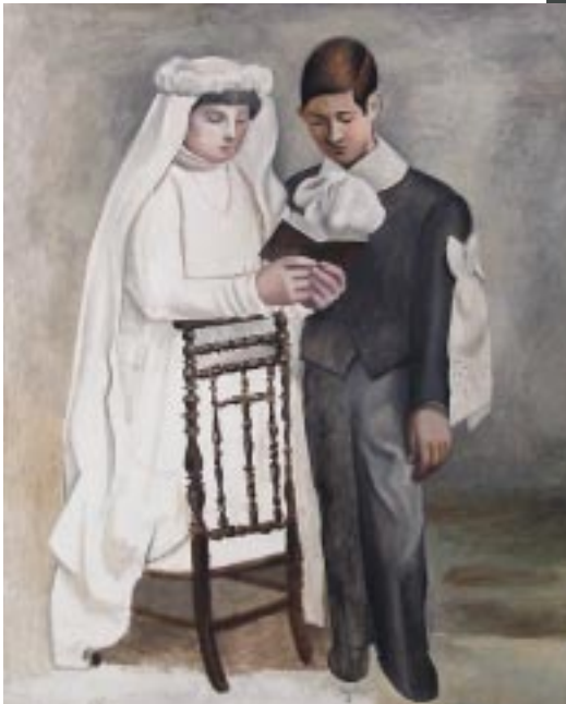
Pablo Picasso Les premiers communians, 1919

Il percorso ci conduce attraverso una rilettura degli episodi artistici più significativi dal Seicento all'Ottocento, al secolo dello stato paterno e paternalista, educatore e riformatore, ospitale e ospedaliero, fino alla fotografia e all'arte del Novecento.