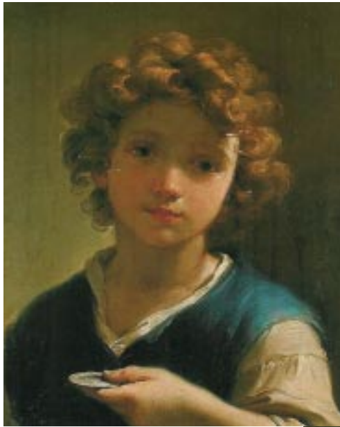
Ubaldo Gandolfi Fanciullo con una moneta, 1777-78