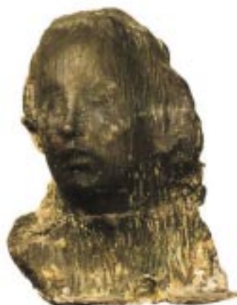
Medardo Rosso Ecce Puer

C'è un altro modo di accostarsi all'infanzia ed è quello che fin dal Seicento ha cercato di testimoniare, se non di denunciare, l'età dell'innocenza e della fragilità sottoposta ai soprusi, alla sofferenza, all'abbandono, alle infinite violenze generate dal mondo degli adulti. L'infanzia indifesa e sovrapposta è allora il simbolo per eccellenza dell'assoluta mancanza di difesa. È il bambino costretto a diventare subito adulto o a non diventarlo mai, vittima di ogni genere di soprusi e di violenza. Forza lavoro e giocattolo, gratuito e silenzioso. Al male, al cinismo, alla perversione, all'egoismo, al disagio, al terrore l'arte ha sempre cercato di rispondere senza chiudere gli occhi, come attestano le mirabili rappresentazioni tragiche della Strage degli innocenti , l'orrore rimandato ai tempi biblici che deve sollecitare la riflessione sul presente.