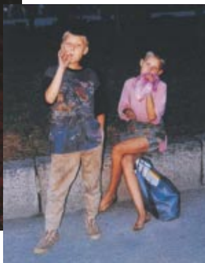
Boris Mikhailov Case History, 1999

Dai grandi ritrattisti dell'età vittoriana, dalle "istantanee" incise da Gustav Doré , che al degrado e alla miserevole condizione dei poverelli di Londra ha dedicato particolare attenzione, si passa alla foto degli Alinari, che associano alla documentazione sociale la poesia di viaggiatori intrisi di sentimentalismo e filantropia, e si arriva fino ai reporter impegnati sui fronti più sanguinosi e drammatici del mondo.