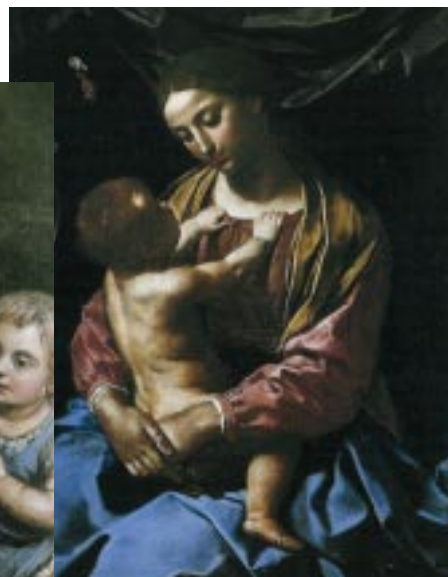
Simone Cantarini Madonna col Bambino