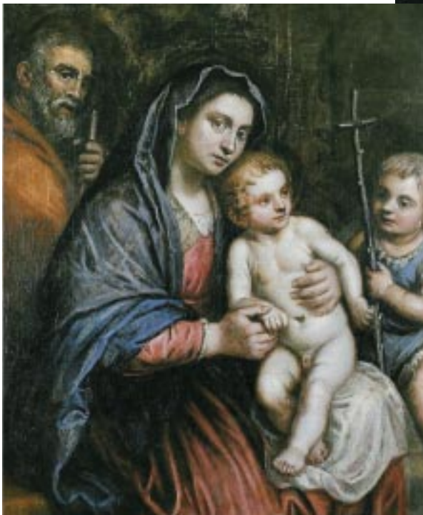
Domenico Robusti detto il Tintoretto Sacra Famiglia con San Giovannino, 1600-10

I “primi passi” del bambino, che tentenna e danza ad un tempo, con un ritmo paragonabile solo ai moti del suo spirito, della sua immaginazione e sensibilità, al modo di pronunciare parole e nominare il mondo, la prima vera poetica del linguaggio, saranno anche quelli di una pittura o scultura antigraziosa o arcaica, come quella di Medardo Rosso e Brancusi , di Picasso e di Carrà , di Dubuffet e Klee , che ritrovano un'arte “originale” recuperando i gesti e l'espressività, il lin- guaggio corporeo e onirico dell'infanzia.