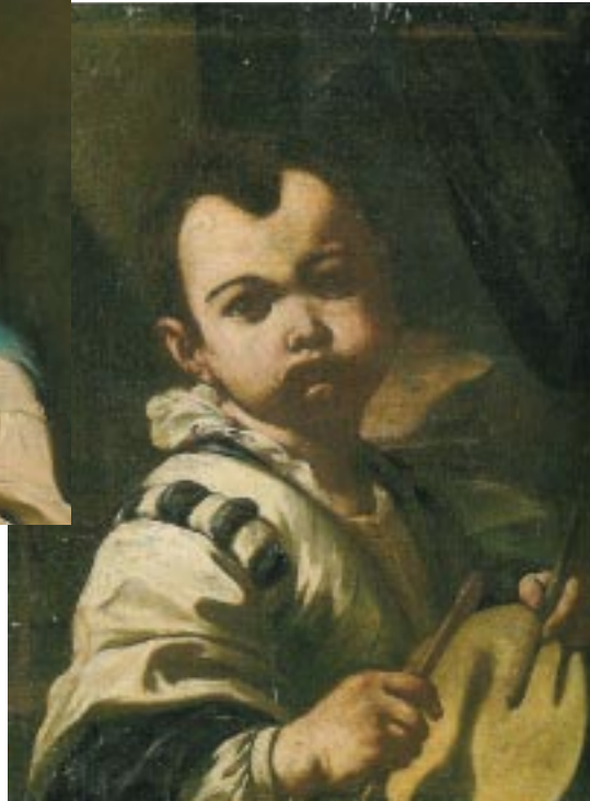
Antonio Mercurio Amorosi Ritratto di fanciullo con tamburo

Il fanciullo, il bambino, l'infante, che dorme (Caravaggio) o che gioca (Chardin) o che vive "esposto" alla "violenza o ingiustizia" del mondo degli adulti (Murillo), è lo stesso che in altre e successive epoche sarà considerato il vero protagonista dell'età aurea (Medardo Rosso), dell'era prometeica (Brancusi), o della tragedia dell'infanzia (Savinio). I quadri di Greuze e di Chardin, di Runge, di Previati e Mary Cassats, Picasso, Carrà o Mirò aprono per noi spiragli importanti di questa dimensione.