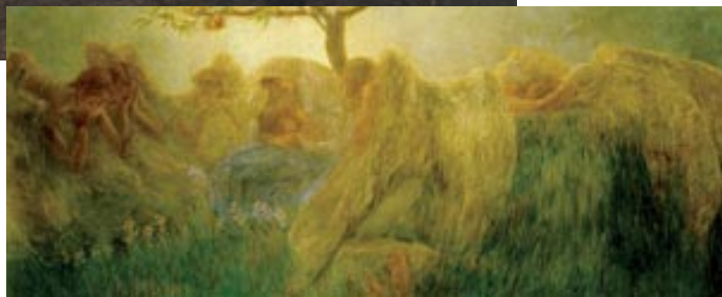
Gaetano Previati Maternità, 1890-91

Il fanciullo disarmato, cioè l'adulto, soffre fino in fondo l'esperienza dell'abbandono coercitivo dell'infanzia e la rivelazione del tempo che passa, della mancanza e della morte, la perdita degli affetti e d'aura, potremmo dire, patisce la secolarizzazione dello stupore. È questa come scriveva Savinio la tragedia dell'infanzia . Il fanciullo, discepolo e magister, assomiglia inspiegabilmente a quelle figure evocate da Rilke e da Klee. Ancora più vicine al mondo animale e spesso accompagnate ad angeli. Dobbiamo accostarci ai bambini in quanto sono proprio essi ad abitare l'infanzia, l' età dell'innocenza , aetas aurea . Ecco perché il mondo sarà salvato da loro , dai fanciullini, gli eletti ad una visione superiore.