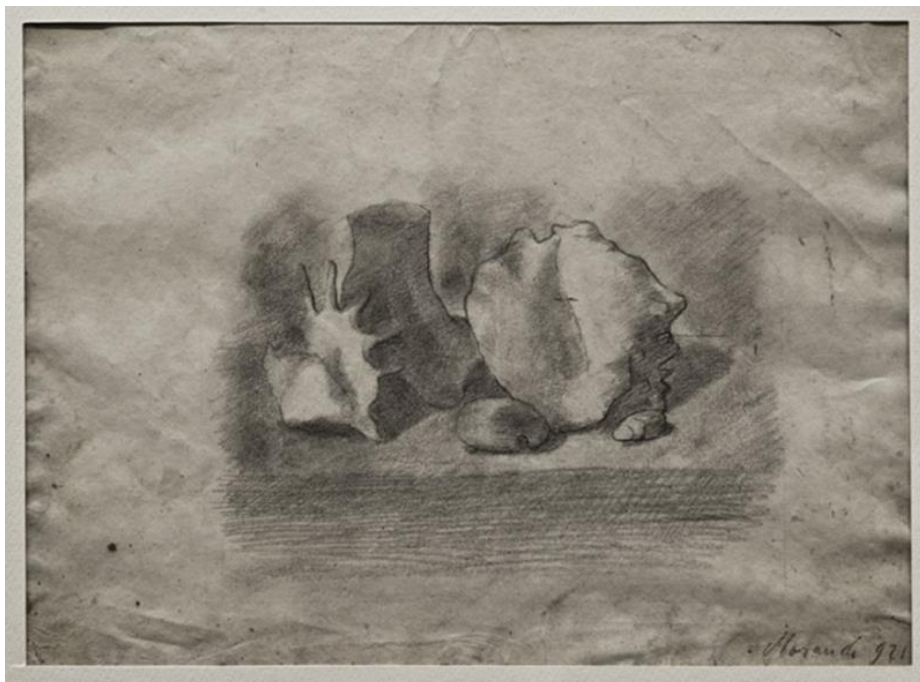
2-4 GIORGIO MORANDI, NATURA MORTA, 1921, © ALBERTO BORTOLUZZI.