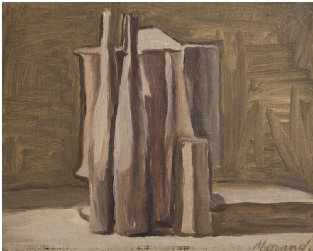
1-4 GIORGIO MORANDI, NATURA MORTA, 1947, © ALBERTO BORTOLUZZI.