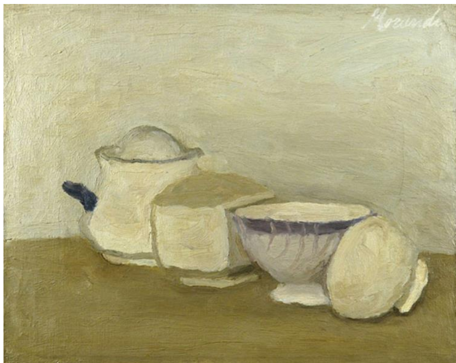
4-4 GIORGIO MORANDI, NATURA MORTA 1943, © ALBERTO BORTOLUZZI.

C osa può accadere quando un grande artista di oggi decide di dare nuove interpretazioni al lavoro di un altro maestro, magari lontano nel tempo e nello spazio? È la domanda al centro della mostra " Giorgio Morandi e Tacita Dean. Semplice come tutta la mia vita ", dal 12 marzo al 4 giugno negli spazi del Centro Internazionale d'Arte e Cultura di Palazzo Te a Mantova.