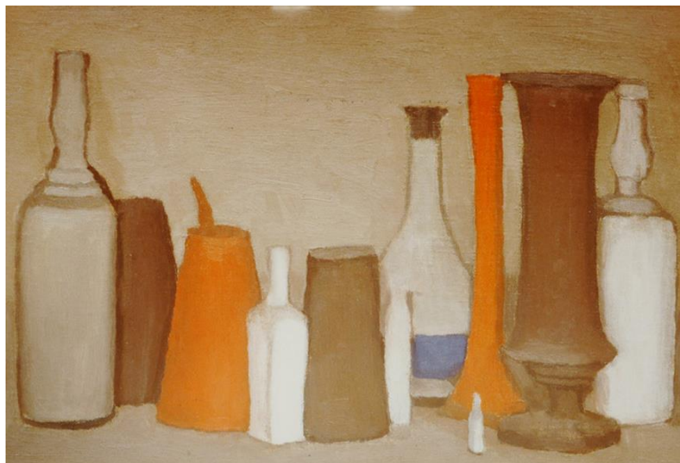
3-4 GIORGIO MORANDI, NATURA MORTA CON BOTTIGLIE, 1938, © ALBERTO BORTOLUZZI.