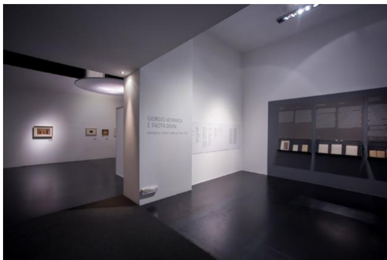
Mostra Giorgio Morandi e Tacita Dean a Palazzo Te

suggerisce una direzione della visione in cui l'enigma, la distanza irriducibile del lavoro di Morandi, è messa a tema e nello stesso tempo significata, proposta come motivo di rispetto».