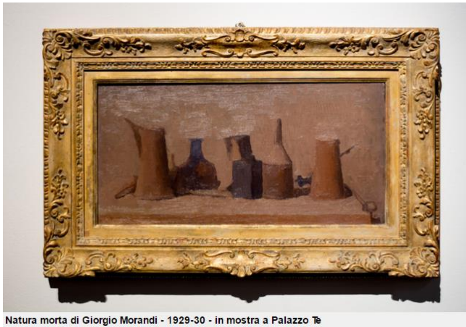
Natura morta di Giorgio Morandi - 1929-30 - in mostra a Palazzo Te

Partendo dagli oggetti cari a Morandi, il processo di creazione artistica attivato dall'osservazione e dalla meditazione sulle cose è il punto di incontro dei lavori dei due artisti.