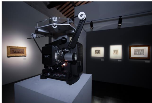
Mostra Giorgio Morandi e Tacita Dean a Palazzo Te

Semplice come tutta la mia vita fino al 4 giugno al Palazzo Te di Mantova