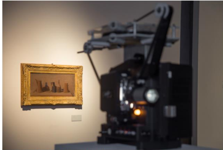
Mostra Giorgio Morandi e Tacita Dean a Palazzo Te

L'esposizione mette a confronto una raccolta di cinquanta opere di Giorgio Morandi e due film, Day for Night e Still life , realizzati nello studio morandiano dall'artista inglese Tacita Dean, una delle più importanti e riconosciute artiste della scena mondiale contemporanea.