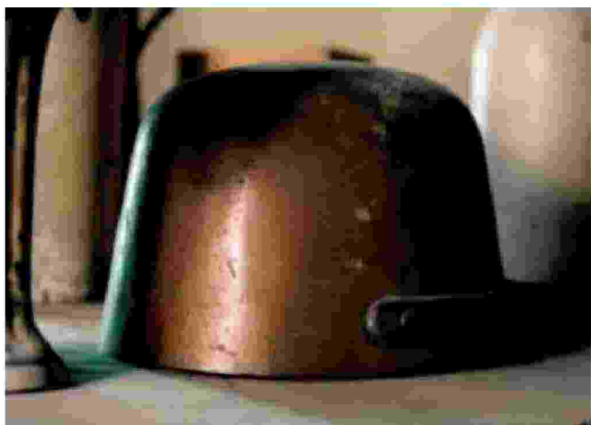
Un fotogramma del film «Day for Night» di Tacita Dean, del 2009