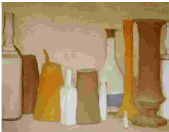
Una delle celebri «Nature morte» di Morandi, un olio del 1938