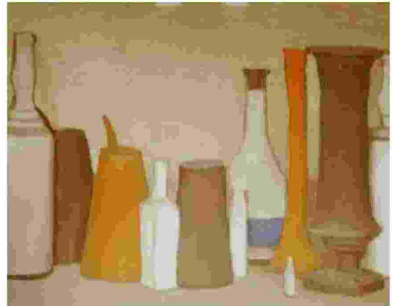
Una delle celebri «Nature morte» di Morandi, un olio del 1938

I film raccontano un mondo limitato, polveroso, dimesso e domestico, dove cose umili - bottiglie, tazze, lumi,