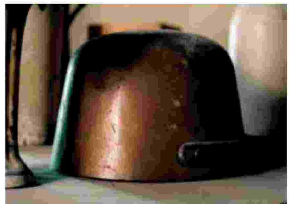
Un fotogramma del film «Day for Night» di Tacita Dean, del 2009