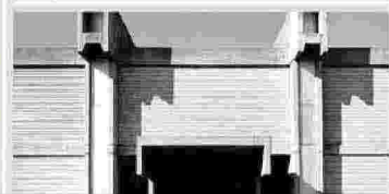
Un particolare dell'invito della mostra dedicata all'arte tessile targata Ratti