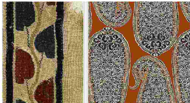
Mantova, Palazzo Te 01.10.2017—07.01.2018