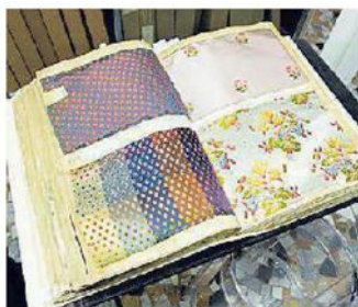
Particolare di alcuni tessuti