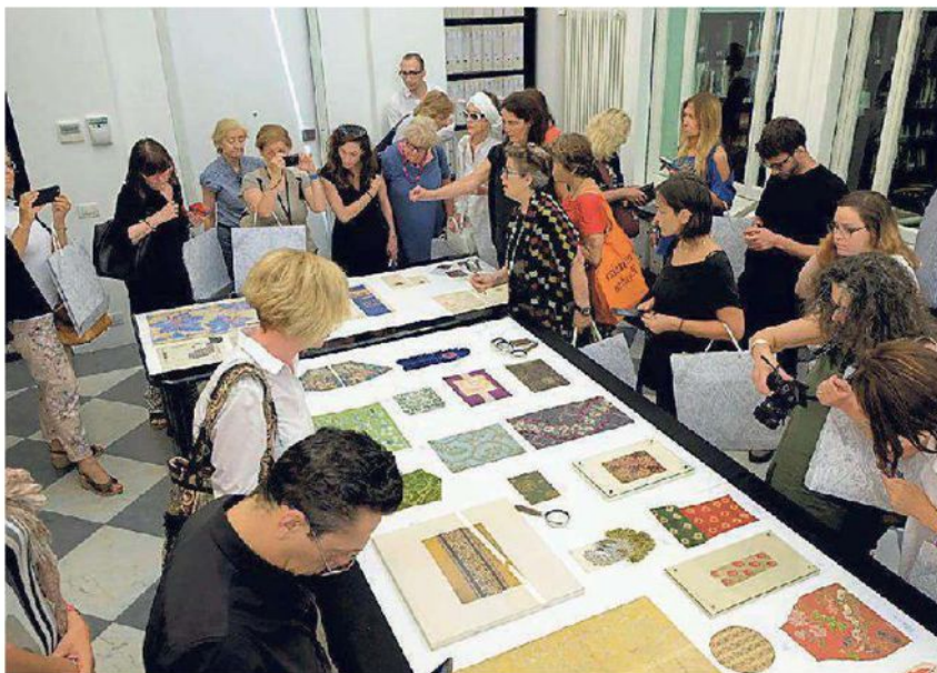
Sopra la conferenza di presentazione e sotto il tour ieri alla fondazione di Como