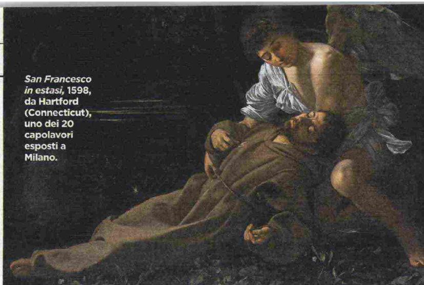
San Francesco in estasi, 1598, da Hartford (Connecticut), uno dei 20 capolavori esposti a Milano.