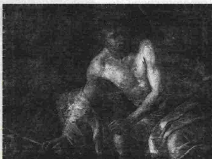
Sopra, San Giovanni Battista , 1604, da Roma, Galleria Corsini (anche conosciuto come San Giovannino Corsini ), e, a destra, la stessa immagine radiografata.