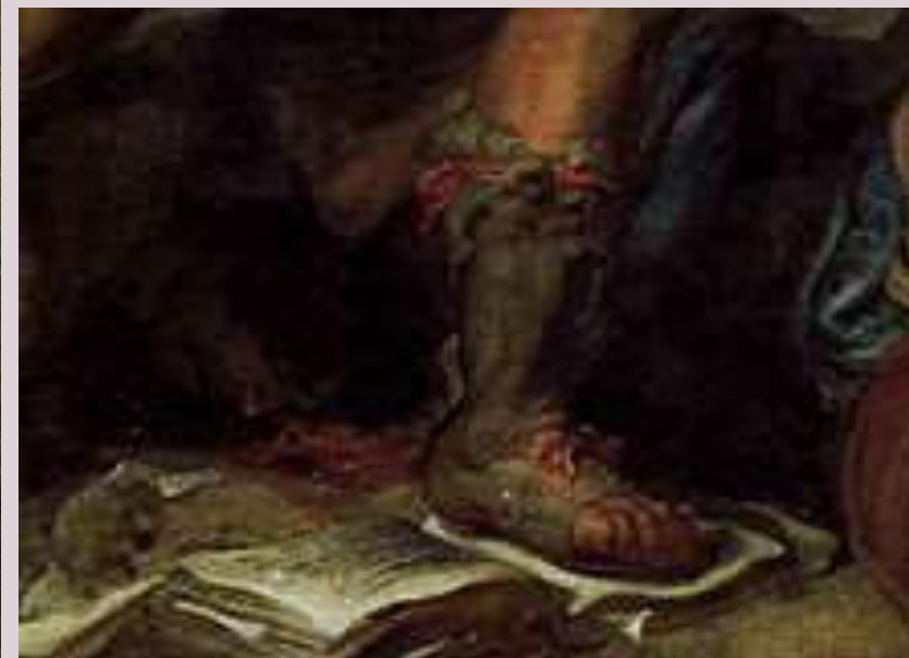
Peter Paul Rubens, Le conseguenze della Guerra , 1637-1638, olio su tela, 206x305 cm., Firenze, Palazzo Pitti, Galleria Palatina.