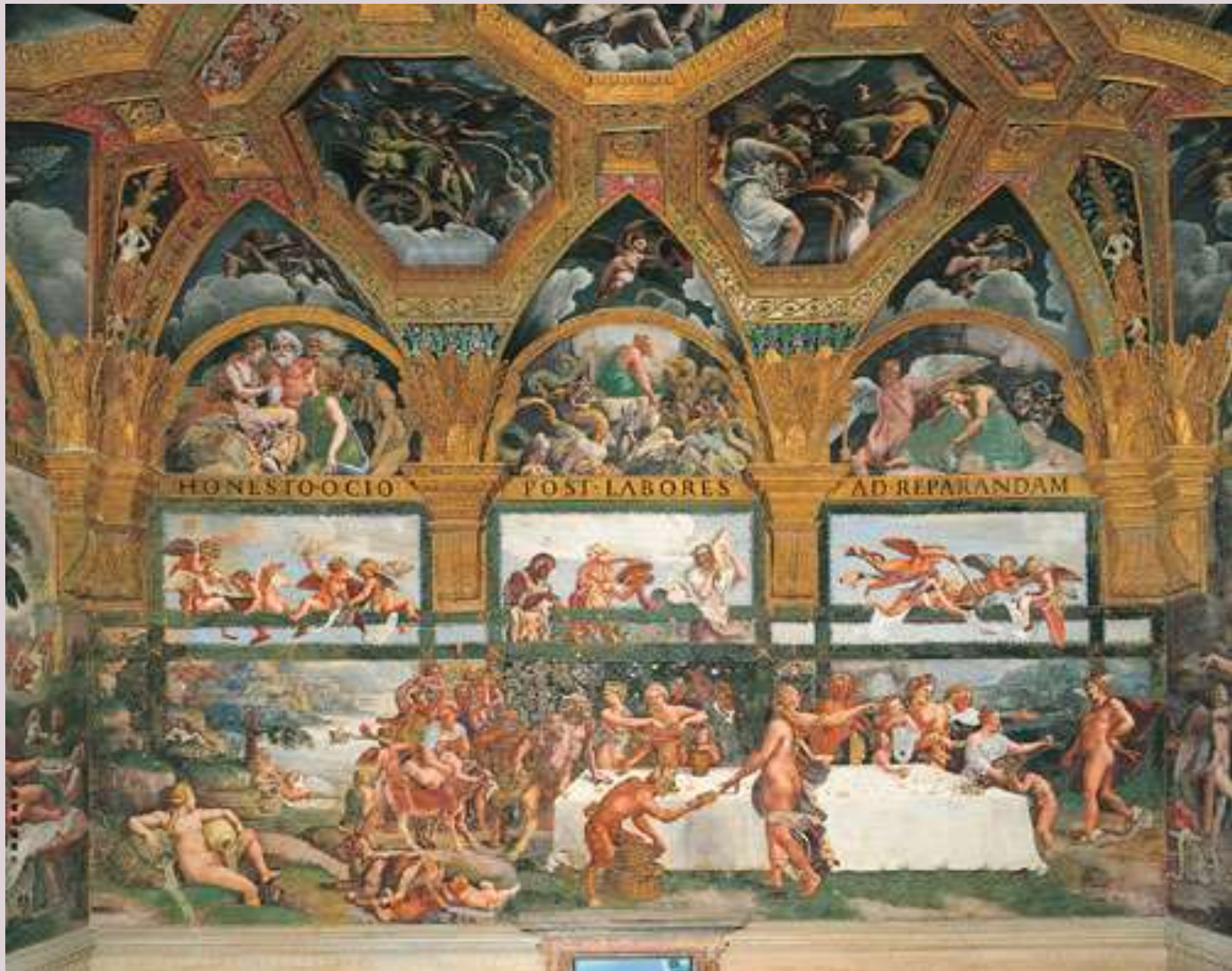
Sala di Amore e Psiche - Parete Ovest – Banchetto Rustico