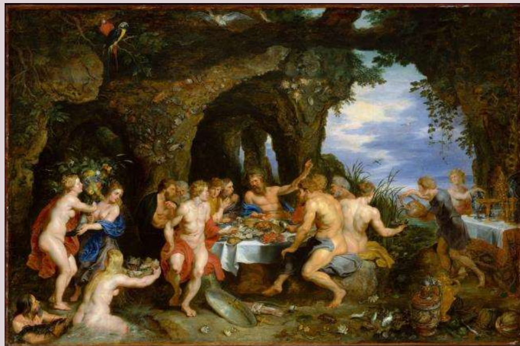
Jan Brueghel il Vecchio e Peter Paul Rubens, Festino di Acheloo e Teti , 1615 ca., olio su tavola, 109,5x165,7 cm., New York, The Metropolitan Museum of Art