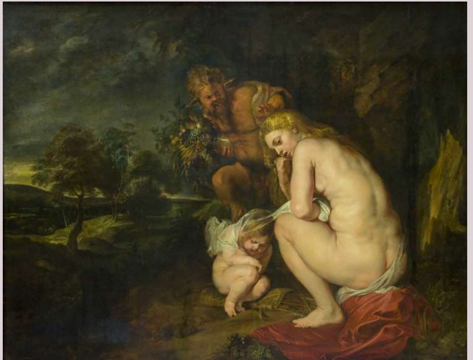
Peter Paul Rubens, Venus Frigida , 1611, olio su tavola, 145x185 cm., Anversa, Koninklijk Museum voor Schone Kunsten