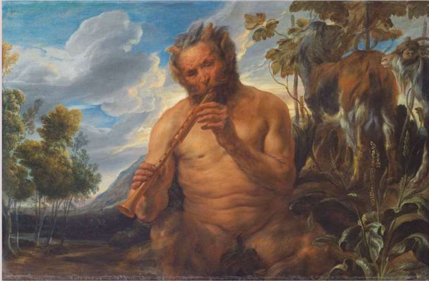
Jacob Jordaens, Satiro che suona il flauto (1639 ca., olio su tela, 99x105 cm., Bilbao, Fine Arts Museum)