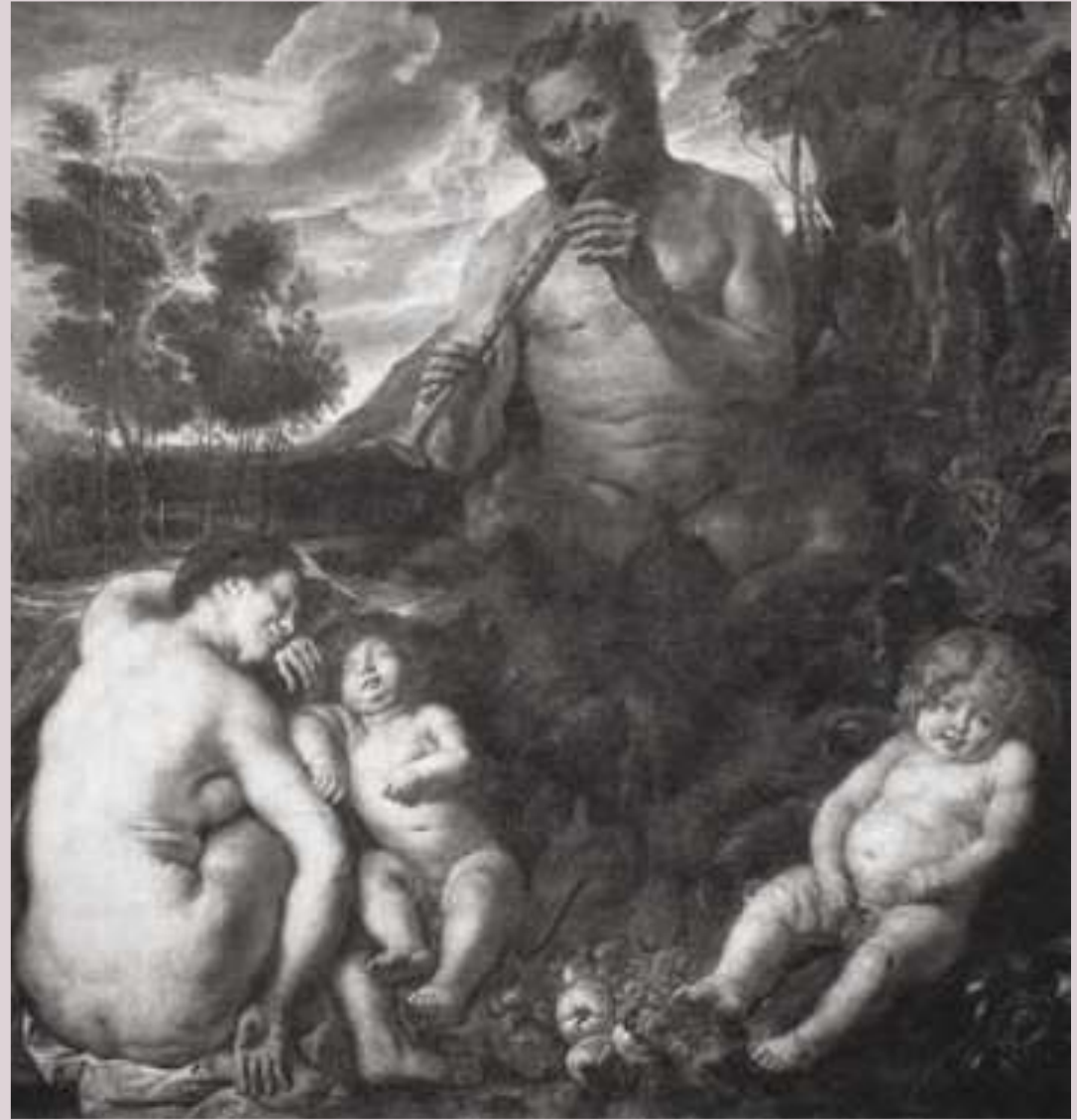
Jacob Jordaens, Satiro che suona il flauto (1639 ca., olio su tela, 99x105 cm., Bilbao, Fine Arts Museum)