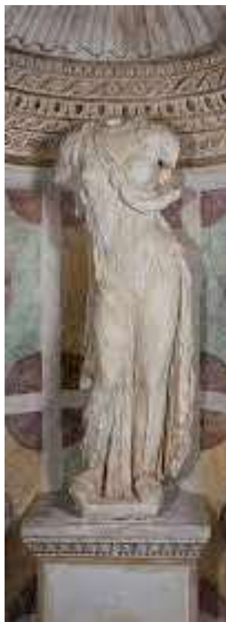
Afrodite velata , II a.C., Mantova, Palazzo Ducale