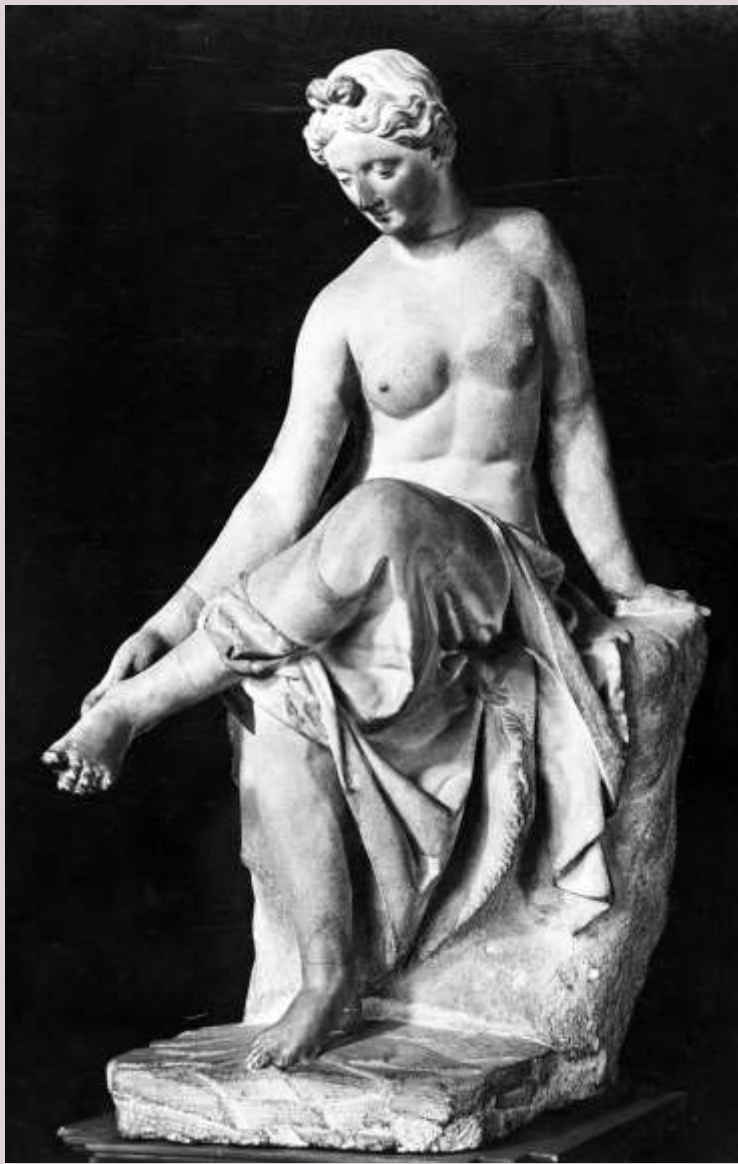
Ninfa Spinaria , marmo, h. 101, II sec. d.C., Firenze, Uffizi, inv. n. 190