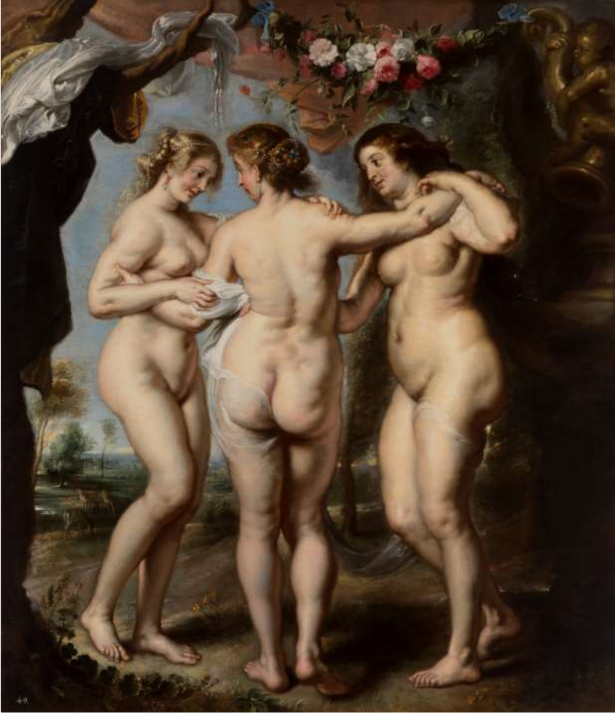
Peter Paul Rubens, Tre Grazie , 1638 ca., olio su tela, 210x181 cm., collezione privata