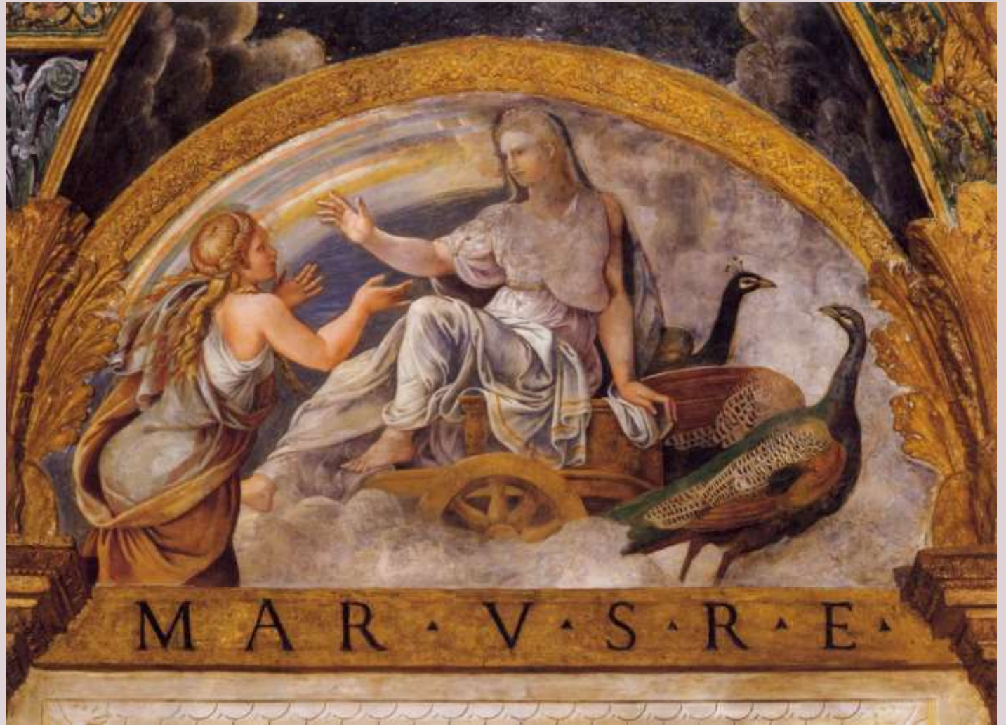
Sala di Amore e Psiche – Lunetta del soffitto - Psiche che invoca invano l'aiuto di Giunone