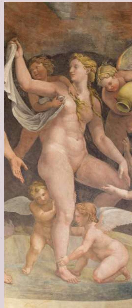
Sala di Amore e Psiche - Parete Nord – Il bagno di Venere