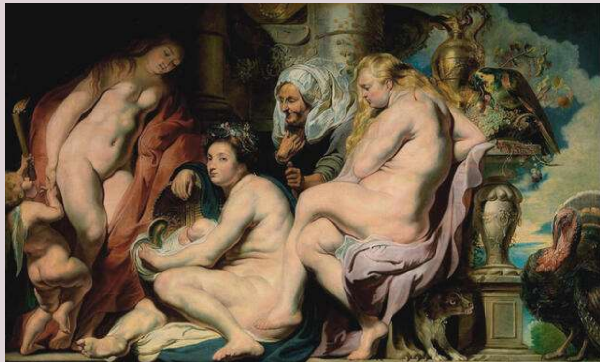
Jacob Jordaens, Le figlie di Cecrope scoprono Erittonio infante , 1617, olio su tela, 169x279 cm., Anversa, Koninklijk Museum voor Schone Kunsten