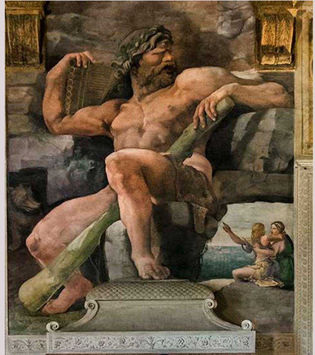
Sala di Amore e Psiche - Parete Est - Polifemo