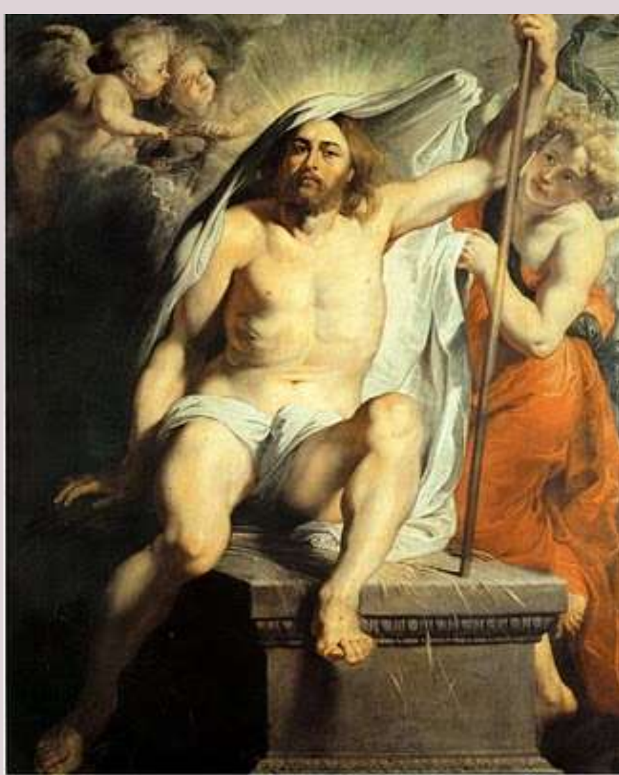
Peter Paul Rubens, Cristo Risorto , 1616, olio su tela, 183x155 cm., Firenze, Palazzo Pitti, Galleria Palatina