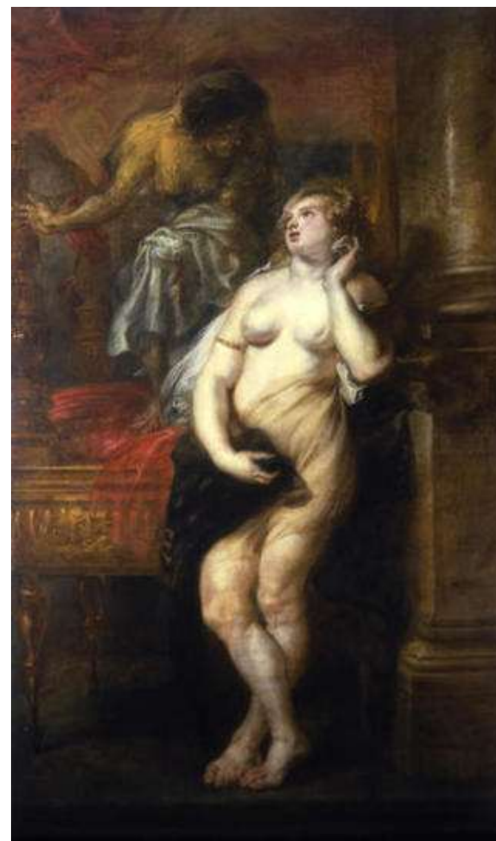
Peter Paul Rubens, Dejanira presta ascolto alla Fama , 1638 ca., Olio su tela, 240,5x143,5 cm., Torino, Musei Reali, Galleria Sabauda