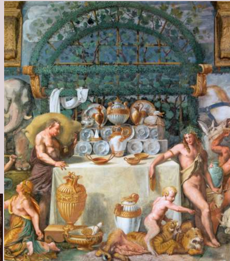
Sala di Amore e Psiche - Parete Sud – Banchetto degli dei