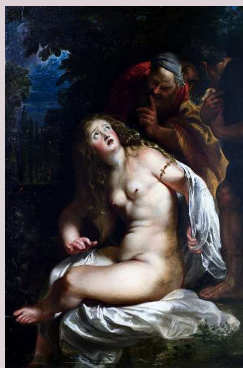
Peter Paul Rubens, Susanna e i Vecchioni , 1607-1608, olio su tela, 94x66 cm., Roma, Galleria Borghese