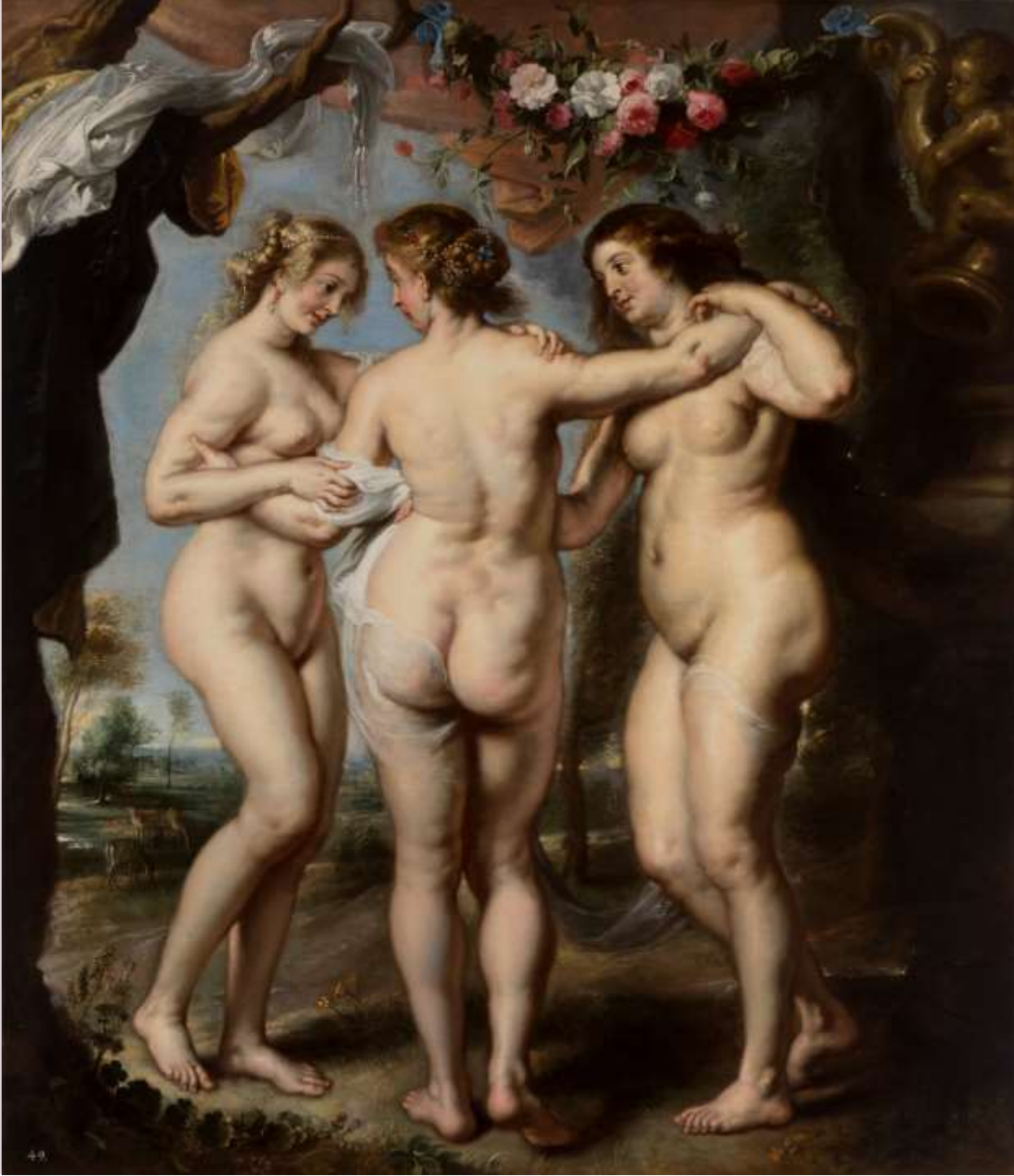
Peter Paul Rubens e bottega, Tre Grazie , 1638 ca., olio su tela, 210x181 cm., collezione privata