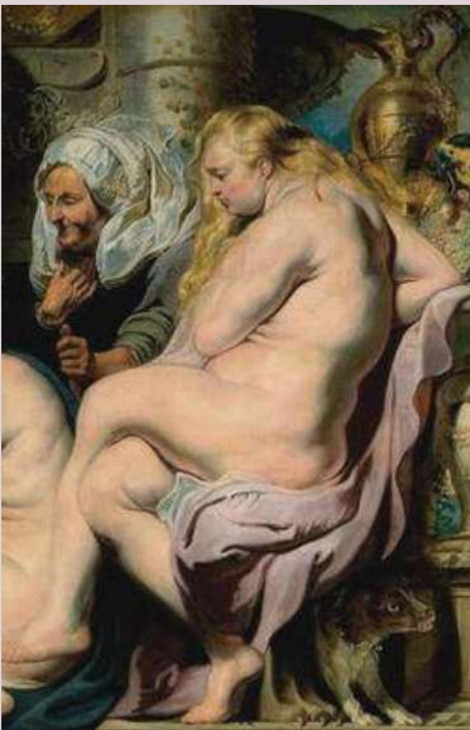
Aglauro da Le figlie di Cecrope scoprono Erittonio infante di Jacob Jordaens