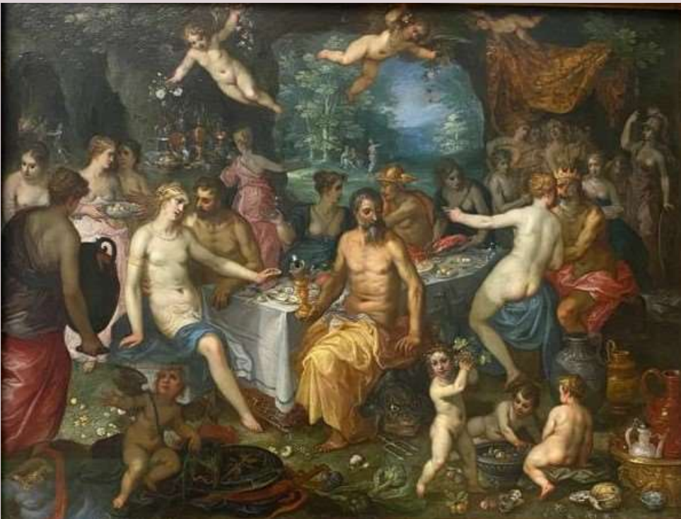
Jan Brueghel il Vecchio, Nozze di Peleo e Teti , 1610 ca., olio su rame, 50,4x61,4 cm., Copenhagen, National Gallery of Denmark