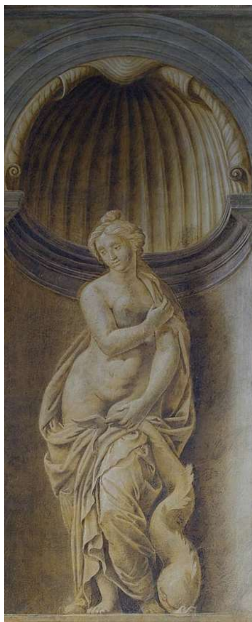
Sala dei cavalli - Venere Marina