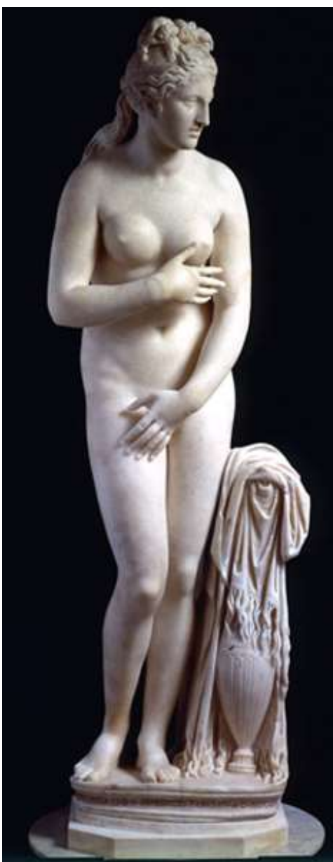
Venus pudica , II a.C., Roma, Musei Capitolini