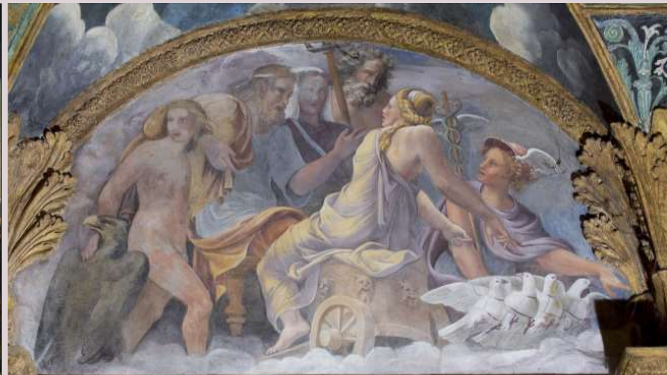
Sala di Amore e Psiche - Lunetta del soffitto – Venere chiede a Giove la disponibilità di Mercurio