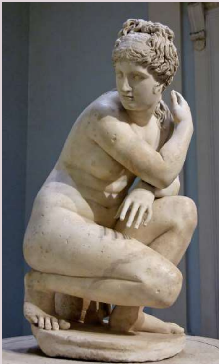
Lely Venus , II d.C., London, British Museum